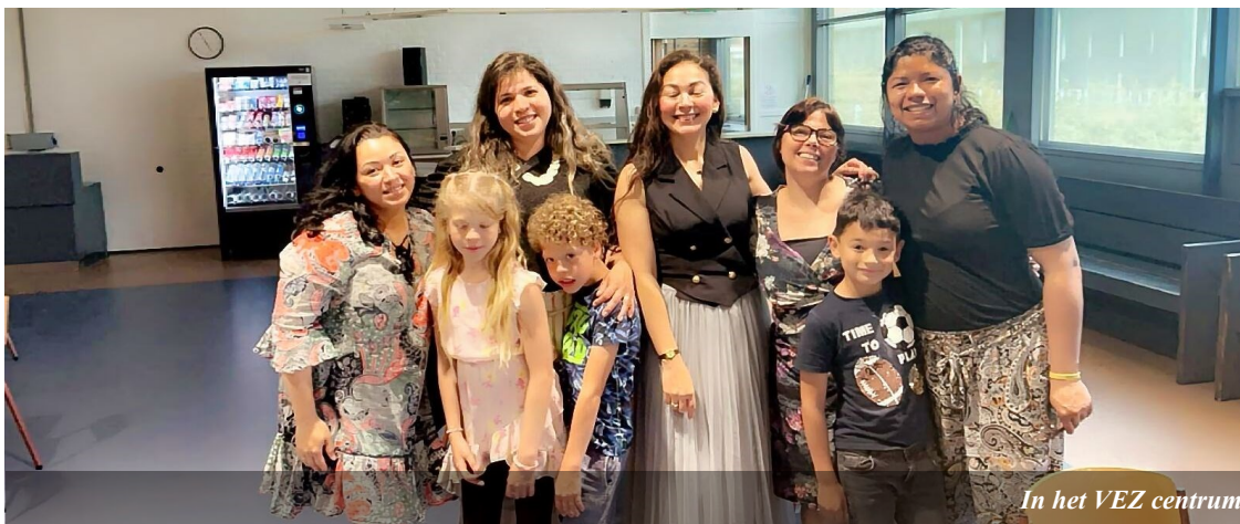
In het VEZ centrum

Een mooie ontwikkeling is dat we met een groep van zes personen een tweejarige training van ICP gaan volgen. ICP staat voor Intercultural Church Plant, een Nederlandse organisatie voor gemeentestichting en -ontwikkeling onder multiculturele groepen in Nederland. Er zijn al flink wat migratiekerken bij aangesloten. In oktober start de cursus en