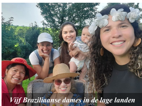
Vijf Braziliaanse dames in de lage landen